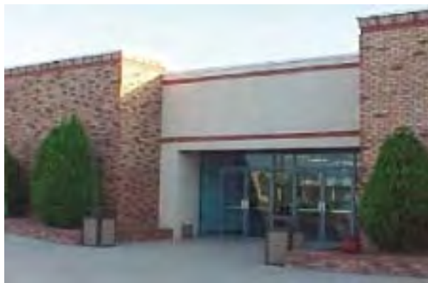
Río Bravo Eléctricos, S.A. de C.V.

Proceso de producción: se recibe la materia prima, la cual se inspecciona y almacena, se transporta al proceso, donde los cables son cortados y les aplican una terminal en cada extremo para pasar al área de ensamble en donde con la conjunción de otros múltiples componentes de plástico y metal, son confeccionados los arneses; dependiendo del número de partes a producir, se prueban eléctricamente y se les realizan diversas inspecciones de calidad, se empacan, identifican y se transportan al área de producto terminado para ser enviados finalmente a las plantas de ensamble de vehículos.