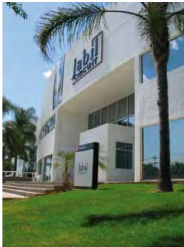
Jabil Circuit de México, S. de R.L. de C.V.

El proceso de producción es: impresión del circuito en la tablilla, colocación de componentes con base en el circuito eléctrico, ensamble manual y soldado a través de soldadora de ola, inspección, prueba eléctrica y empaque.