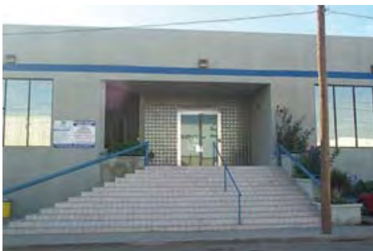
Óptica Sola de México, S. de R.L. de C.V.

El proceso de elaboración de los moldes y lentes oftálmicos de vidrio es el siguiente: recepción de vidrio en bruto; generado; biseado; pulido; lavado y secado; colocación de las piezas sin terminar en el banco o almacén temporal; órdenes de pieza sin terminar para horno; preparación del bloque para horno; limpieza de bloques con brocha; arenado de bloques y limpieza de marcas de desplomado; limpieza de la orilla de los bloques; cargado de bloques de cerámica en el horno; revisión del vacío en el horno; limpieza de piezas; envío de moldes a producción de lentes, no sin antes pasar en varias ocasiones por el departamento de control de calidad.