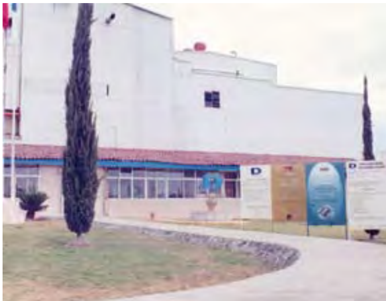
Derivados Macroquímicos, S.A. de C.V.

La aplicación del diagnóstico inicial arrojó como resultado, un cumplimiento de la normatividad de 100% con algunas áreas de mejora, como por ejemplo: señalamientos de seguridad e higiene, capacitación de la Comisión de Seguridad e Higiene, detectores de humo y botiquín de primeros auxilios.