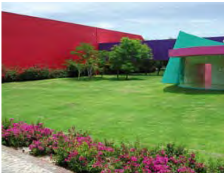
Laboratorios Senosiain, S.A. de C.V.

Al inicio del programa de Autogestión, venían desarrollando planes de trabajo para cumplir con la normatividad, pero no contaba con un sistema integral que indicara los avances y mejoras del mismo. En el diagnóstico de 1999 se observó el registro de 3 accidentes y durante 2004 de 2 con una tasa de incidencia de 0.86%.