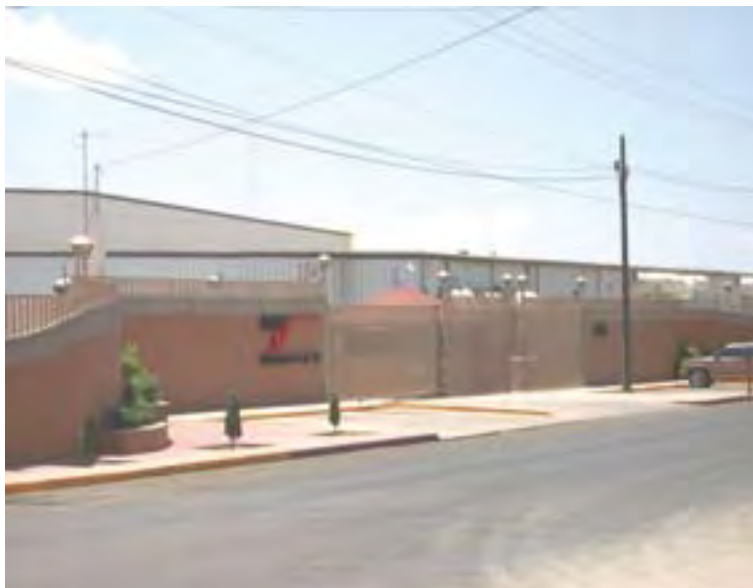
Velcromex, S.A. de C.V.

La empresa inicialmente, no contaba con un Sistema de Administración de la Seguridad y Salud en el Trabajo, SASST, por lo que no había una cobertura total de la normatividad, la detección de oportunidades de mejoras eran escasas, se detectaban a través de recorridos poco organizados de la Comisión de Seguridad e Higiene y de las visitas de inspección de la Secretaría del Trabajo y Previsión Social. Bajo estas circunstancias, en el año 2000 las estadísticas sobre accidentes de trabajo no fueron buenas, ya que se tuvieron 54 con una tasa de incidencia de 4.57%.