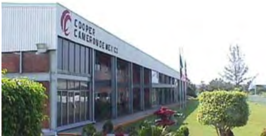
Cooper Cameron de México, S.A. de C.V.

La empresa cuenta con un Sistema de Administración en Salud, Seguridad y Cuidado al Medio Ambiente, basado en los lineamientos de OSHA e ISO 9000 que se implementó y adaptó a los requerimientos normativos de México.