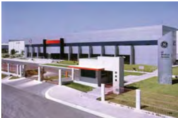
GE Medical Systems, Monterrey México, S.A. de C.V.

Antes de su incorporación al Programa Auto-gestión, trabajaba solamente con el Programa de Salud y Seguridad de GE, el cual consta de 21 elementos o tópicos, pero los empleados no tenían conocimiento al 100%, sobre el compromiso y la relación existente entre empresa-gobierno y gobierno-empresa.