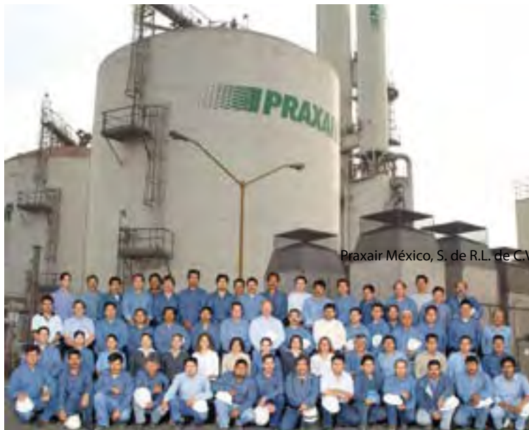
Praxair México, S. de R.L. de C.V.

Proceso: la materia prima de los productos es el aire del medio ambiente, al cual se le extraen los contaminantes, tales como la humedad, partículas de polvo, bióxido de carbono y algunos hidrocarburos, posteriormente se envía a un gran intercambiador