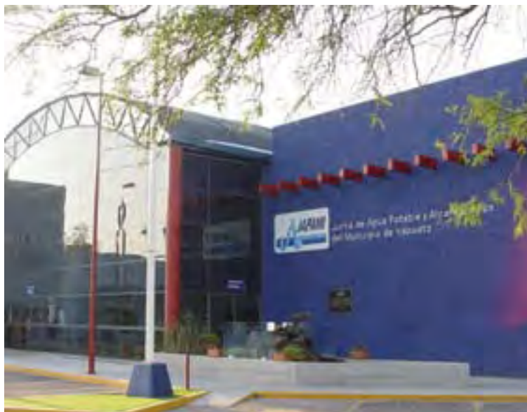
JAPAMI, Junta de Agua Potable y Alcantarillado del Municipio de Irapuato

No había señalamientos, brigadas, extintores, kit de cloración, equipo de seguridad personal, equipo contra incendio, equipo de cloración, capacitación del personal, límites de área para