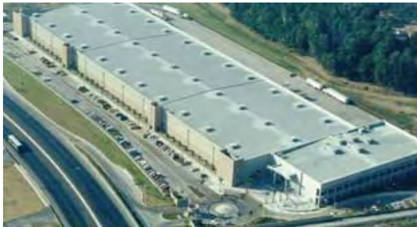
Hewlett-Packard México, S. de R.L. de C.V.

En relación con los accidentes y riesgos de trabajo, no existieron problemas al respecto. Se requería un sistema que permitiera llevar un control sobre los requerimientos de la normatividad, pero en términos generales, se estaba cumpliendo por arriba de un 95% de la misma.