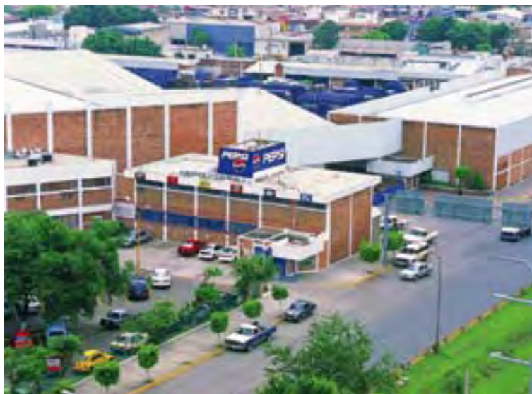
Embotelladora de Occidente, S.A. de C.V.

En noviembre de 1999, se tomó la decisión de firmar el compromiso voluntario del Programa de Autogestión en Seguridad y Salud en el Trabajo. Antes de ingresar a dicho Programa, la empresa no contaba con un sistema definido en esta materia. Con la aplicación del primer diagnóstico situacional, se obtuvo un 92% en daños a la salud, 6 accidentes y una incapacidad permanente parcial. La rotación del personal era del 19.2% y el ausentismo de 3.2%, el cual afectaba en los resultados e indicadores de productividad. Los riesgos asociados al proceso principal, son: ruido, vidrio, manejo de sustancias químicas peligrosas, maquinaria y equipo mecánico, así como las maniobras de carga y descarga de materiales.