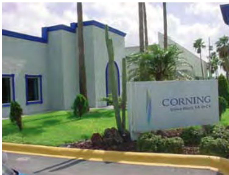
Corning Science México, S.A. de C.V.

La documentación referente a los estudios de seguridad requeridos por las normas se realizaba, pero ahora con el Programa de Autogestión se hacen más completos al involucrar al personal, se da seguimiento a las actividades y hay más apoyo por parte de los supervisores. Además mejoraron las áreas de moldeo y tool room, se registró un accidente en el periodo enero-diciembre del 2001 y no hubo ninguna enfermedad profesional reportada.