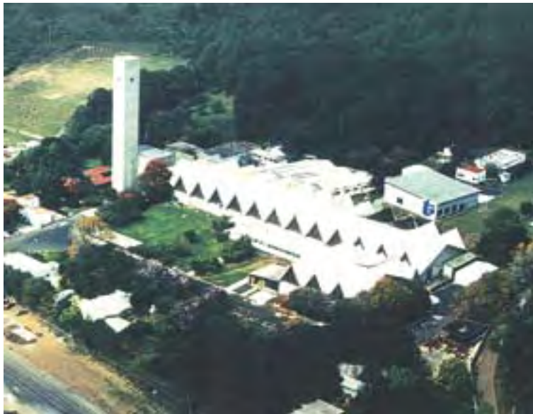
Industrias Tecnos, S.A. de C.V.

El proceso productivo comprende operaciones mecánicas para transformar la cinta de latón y el alambre de plomo en los componentes principales que son el casquillo y el proyectil. También comprende procesos químicos en donde se fabrica la mezcla detonante que inicia la ignición de la pólvora. Finalmente, todos los componentes son reunidos en una operación de ensamble, en donde se incorpora la pólvora al casquillo obteniendo de esta manera el producto terminado.