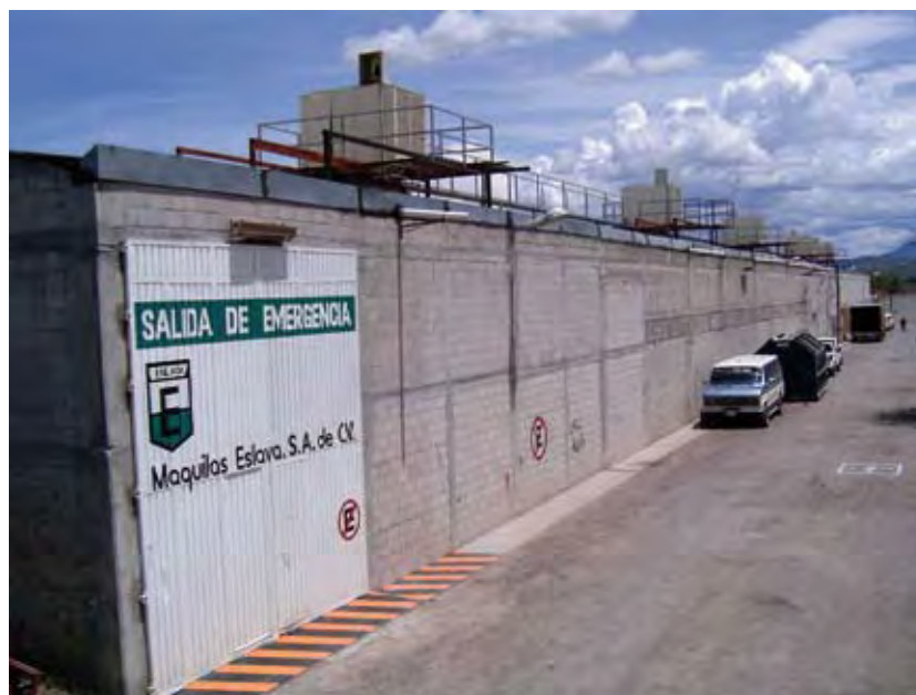
Maquilas Eslava, S.A. de C.V.

Aún cuando Maquilas Eslava ya desarrollaba prácticas internas en materia de seguridad e higiene, no tenía establecido un sistema en la materia, que les permitiera cumplir con los estándares de sus clientes y los lineamientos normativos señalados por las autoridades.