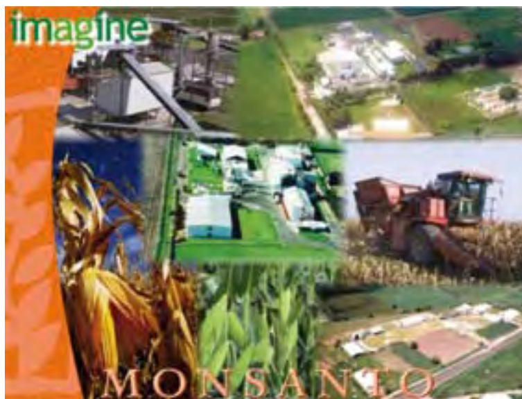
Monsanto Producción y Servicios, S.A. de C.V.

El diagnóstico situacional arrojó el siguiente resultado: Las áreas de mejora se ubicaron en el concepto de involucramiento directivo y en la evaluación normativa, ambas con un 80% de cumplimiento. No se tuvieron registros de accidentes de trabajo durante el año de evaluación. Involucramiento directivo 80%, planeación y aplicación 93%, evaluación de resultados 100%, evaluación normativa 83%, evaluación operativa 100%, control de información y documentos 88%, puntuación global, 91.6%.