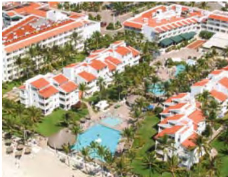
Serviventas de México, S.A. de C.V.

Al momento de su incorporación al Programa de Autogestión, la empresa no contaba con la mayoría de manuales y documentación en materia de seguridad e higiene, realizaba sus procedimientos con poca proyección y medición, el personal no tenía plena conciencia sobre la importancia de la seguridad e higiene en el trabajo. En el año previo a su incorporación al Programa, registró 20 accidentes de trabajo de acuerdo al diagnóstico inicial, y su nivel de cumplimiento de la normatividad fue del 90%.