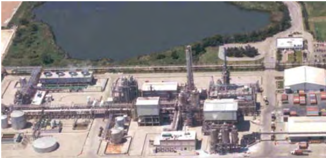
Productora de Tereftalatos de Altamira, S.A. de C.V.

Como resultado de la evaluación en el diagnóstico inicial, la empresa logró una calificación de cumplimiento global del 85%, estructura básica y necesaria para operar de manera segura. En el caso de accidentes de trabajo, se presentaron solo incidentes que si bien eran leves y no incapacitantes, les permitía la mejora continua. Cumplía con el 100% de la normatividad aplicable al giro de la empresa y la rotación y ausentismo era de cero, dado el arraigo del personal y la cultura centrada en las personas e integradas a equipos de trabajo como parte de su Filosofía de Gestión de Calidad.