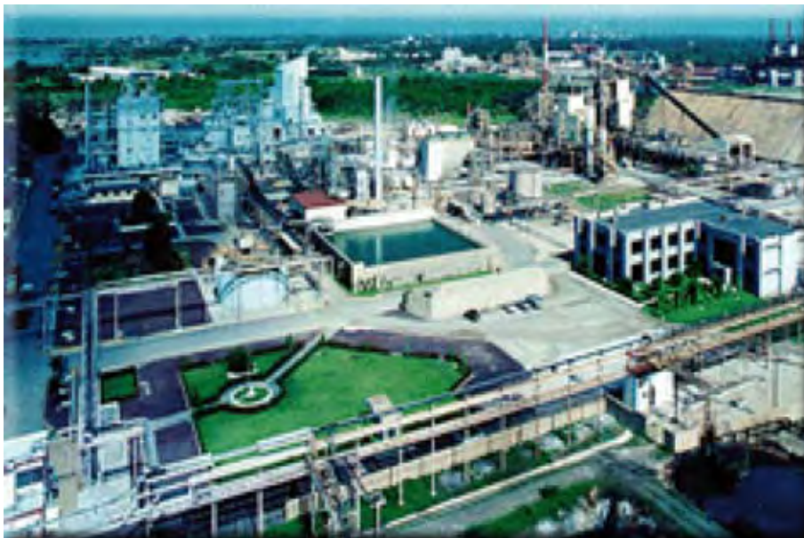
DuPont, S.A. de C.V.

Como la empresa ya contaba con un programa de seguridad al incorporarse al Programa de Autogestión, se presentaron retos importantes para integrar el sistema de administración propio de la empresa con la legislación nacional vigente en seguridad y salud en el trabajo aplicable a su actividad, principalmente sobre la interpretación de la normatividad para el uso y manejo de malacates y para las especificaciones de las escaleras.