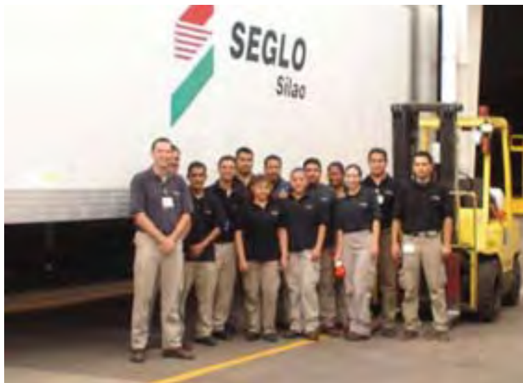
Seglo, S.A. de C.V.

No existían procedimientos que ayudaran a cada uno de los empleados a realizar sus actividades con seguridad. Las áreas operativas tenían condiciones inseguras y fallas administrativas que hacían más riesgosas las operaciones para los empleados. No todo el personal sabía que hacer en caso de una emergencia, como llevar a cabo la revisión de la maquinaria (balancines), no se seguía un proceso de mantenimiento de los dollies, rampas y calzas; no se daba capacitación periódica en seguridad y salud.