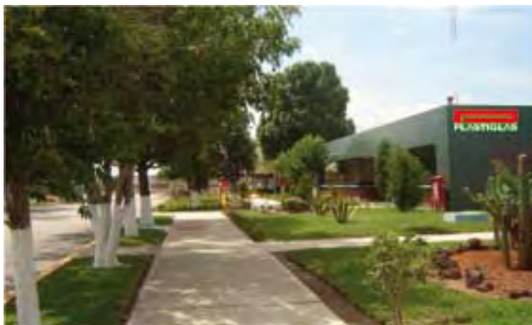
Plastiglas, S.A. de C.V., Planta San Luis Potosi

El proceso que lleva a cabo para la fabricación de los productos, se divide en las etapas siguientes: recepción y almacenamiento de materia prima, prepolimerización, mezclas, moldeo, inspección del producto para garantizar que cumpla con los estándares de calidad establecidos y aceptados por el cliente.