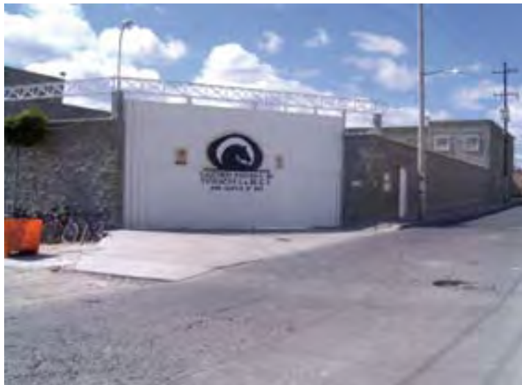
Vaqueros Navarra de Tehuacán, S.A. de C.V., Planta II

La empresa inicialmente solo contaba con prácticas internas relativas a la seguridad e higiene, pero era necesario un sistema en la materia que le permitiera cumplir con los estándares de sus clientes y las normas aplicables, ya que la producción es 100% de exportación. Con el propósito de contar con un Sistema de Administración de la Seguridad y Salud en el Trabajo, SASST, que permitiera alcanzar los objetivos, el 6 de marzo de 2001 empresa y sindicato firmaron el Compromiso Voluntario para ingresar al Programa de Autogestión en Seguridad y Salud en el Trabajo.