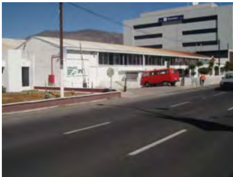
Herramientas Cleveland, S.A. de C.V.

A finales de diciembre de 1967, se recibió en esta Ciudad la maquinaria especializada para la fabricación de brocas y buriles. En agosto de 1969, cambia de razón social a Herramientas Cleveland, S. A., con mayor capital y se logra la autorización para la fabricación de brocas de uso general y de algunos cortadores para el aumento de líneas de productos, bajo la misma patente. En 1970 se empieza a exportar a EUA, Centro y Sudamérica. En noviembre de 1977 Cleveland Twist Drill, Co., adquiere la totalidad de las acciones de Herramientas Cleveland, S.A., dando un nuevo impulso a la fabricación de herramientas de corte. Lanzó nuevos productos al mercado nacional e internacional como los cortadores end-mill, brocas de centros, machuelos y cuchillas.