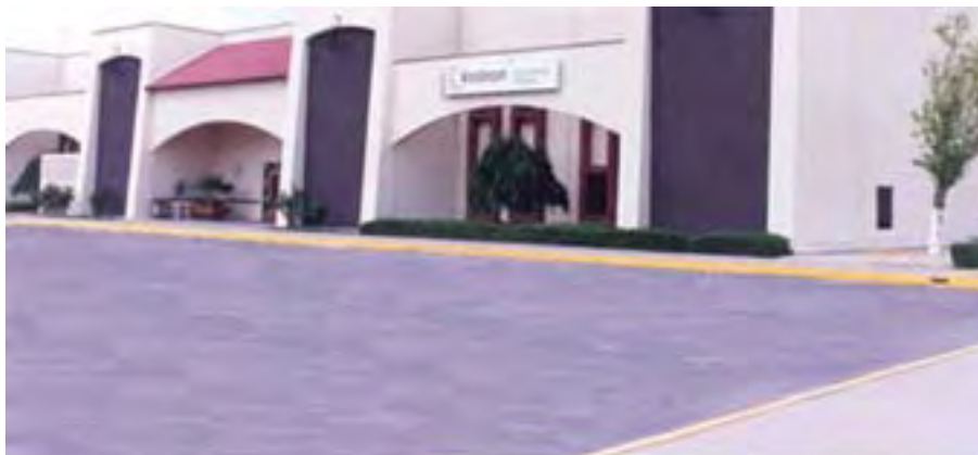
Coclisa, S.A. de C.V., Visteon

Se cuenta con el sistema SHARP en seguridad, por lo que los resultados obtenidos en el 2003 con la evaluación inicial del Programa de Autogestión de la Secretaría del Trabajo y Previsión Social (STPS), fueron satisfactorios ya que a pesar de que se originaron 8 accidentes con el correspondiente tiempo perdido, se obtuvo 90% de cumplimiento de las Normas Oficiales Mexicanas que aplican. El Sistema de Administración de la Seguridad y Salud en el Trabajo, SASST, fungió como evaluador del Sistema SHARP, dando a su vez puntos precisos a corregir para la prevención de accidentes y mejoras en la gestión del propio sistema.